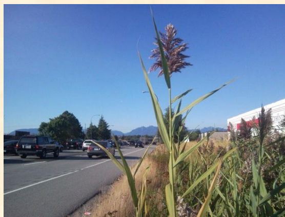
Roseau commun exotique en Colombie-Britannique, comme par hasard en bordure d'une route... (photographie : J. É. Portelance).