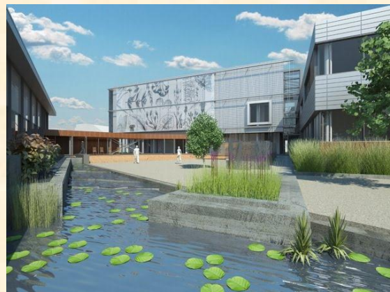
Le tout nouveau Centre sur la biodiversité accueillera en octobre 2011 le 7 e colloque annuel du groupe PHRAGMITES.

donc de vous inscrire à votre tour sans tarder, si ce n'est déjà fait, pour vous assurer une place.