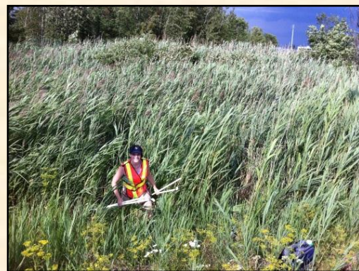
Sampling of common reed for evaluating the impact of climate change on this invader.

Christie-Anna Lovat , a new PhD student of the PHRAGMITES Group (McGill University, Plant Science; supervisor: Sylvie de Blois ), was also very active last summer. The development of common reed populations across four isotherms was tracked over the summer season and compared to the number of growing degree days (a measure of cumulative temperature over time) to determine if populations of common reed respond differently to temperature across different isotherms. This information is vital for determining if cold-adapted biotypes have evolved in Québec, and has implications both for later research in this project as well as the control of common reed in the future. Although analysis remains to be done, preliminary results concerning the stage of initial inflorescence emergence suggest that while populations from Montréal to New York require a similar number of growing degree days in development, cold adapted biotypes may exist in the isotherm of 5.0 – 2.5 °C (that of Québec City).